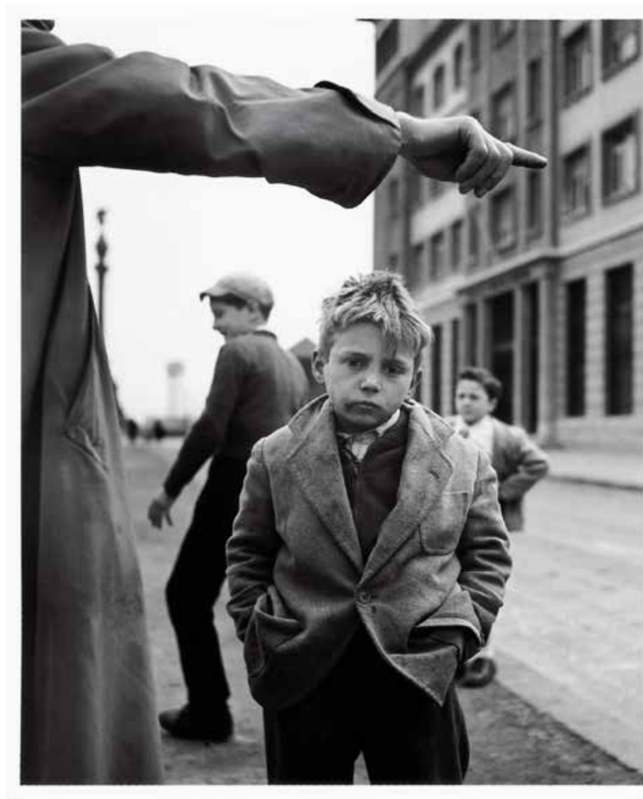
Joan Colom. Sin título. 0-386. Serie "La calle". 1958.

No tengo tiempo: Premios Nacionales de Fotografía en la Colección Alcobendas