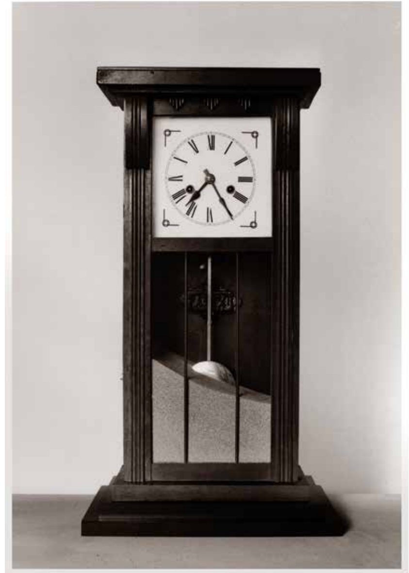
Chema Madoz. Sin título . 2009.

Exponer los fondos de una colección viva, acercarla a todos los públicos, hace que la ciudadanía esté orgullosa de nuestro patrimonio, que a su vez es una de las grandes cartas de presentación de Alcobendas.