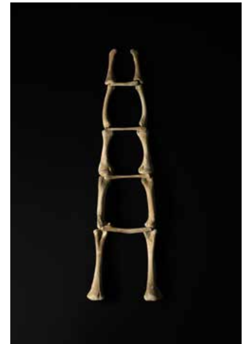
Escalera , Cartografías de Escape . © Luis Carlos Tovar.