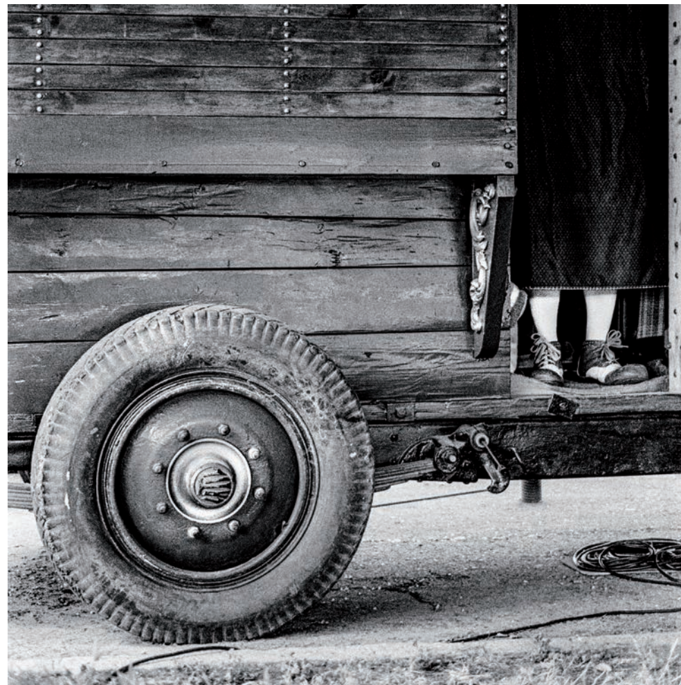
Tintas pigmentadas sobre papel de algodón. 100x100 cm. 2017