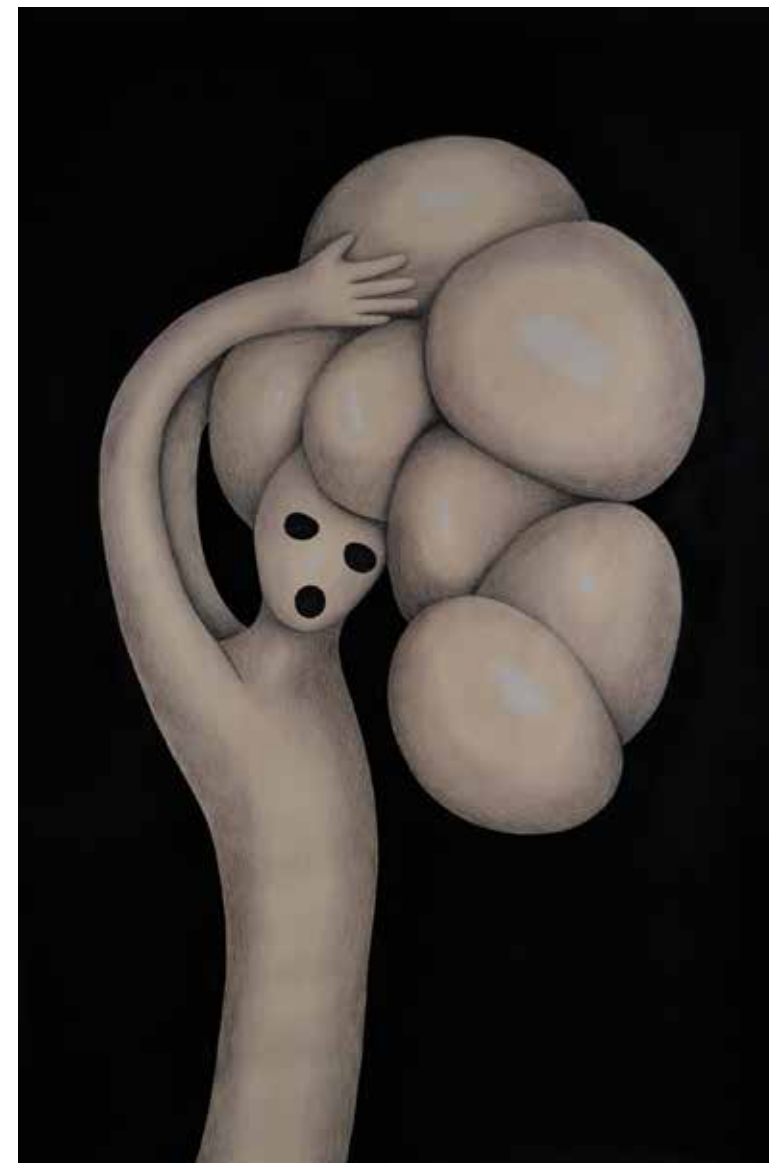
Aflicción 04. Lápices y acrílico sobre papel. 2016