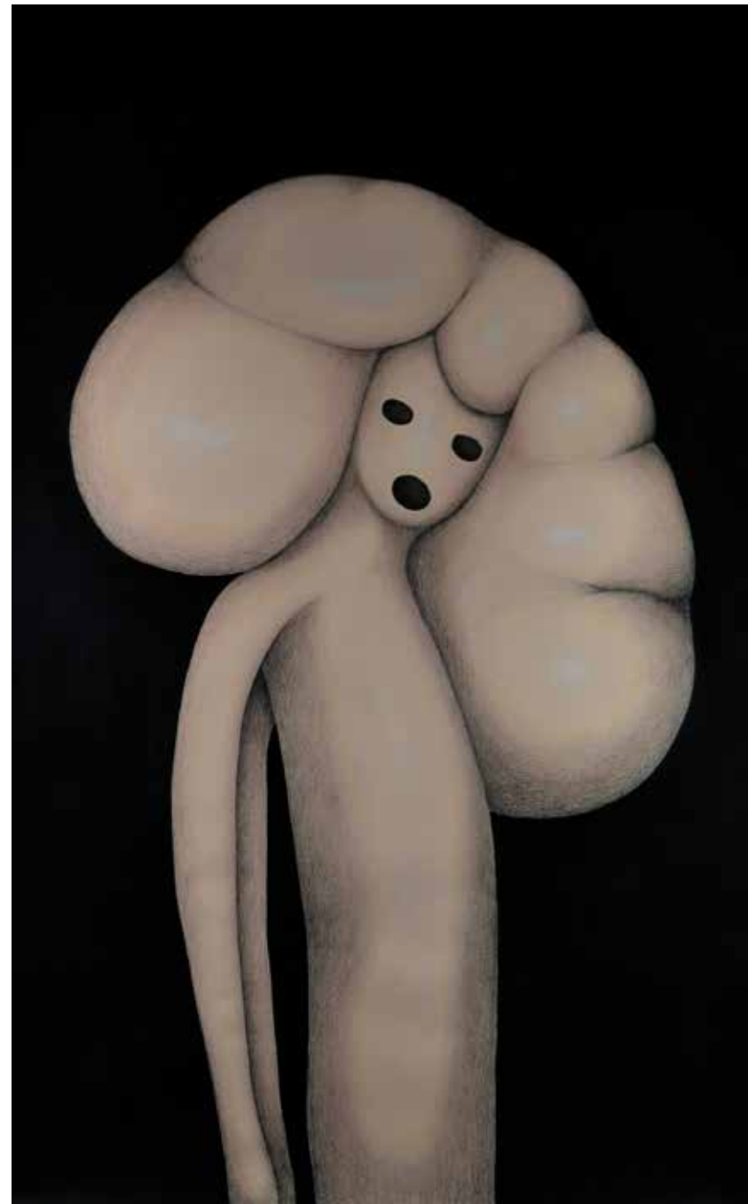
Aflicción 01 . Lápices y acrílico sobre papel. 2016

La tercera línea conductora de la exposición es Sangre , una serie formada por más de 100 dibujos de diferentes formatos cuyo hilo conductor es el rojo, el color de la sangre. Líquido corporal que simboliza la vida y que en la teoría de los cuatro humores, teoría que se considera el principio de la medicina, corresponde a las emociones. Es, por tanto, una representación de la vida, de nuestro vaivén tanto corporal como sentimental en el que lo físico se entremezcla con las vivencias emocionales, sentimentales, que van dibujando nuestro cuerpo, nuestro devenir.