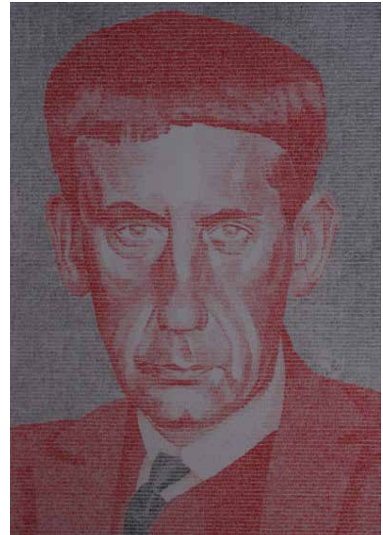
Wg. Tinta china sobre papel britania. 70x50 cm. 2016.

FECHA INICIO: 19/01/17 CLAUSURA: 25/02/17 LUGAR: _CENTRO DE ARTE ALCOBENDAS