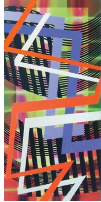
Ornamentales n.º 20, 21 y 18, 2014 Acrílico sobre impresión digital sobre lienzo 240 x 120 x 5 cm c/u