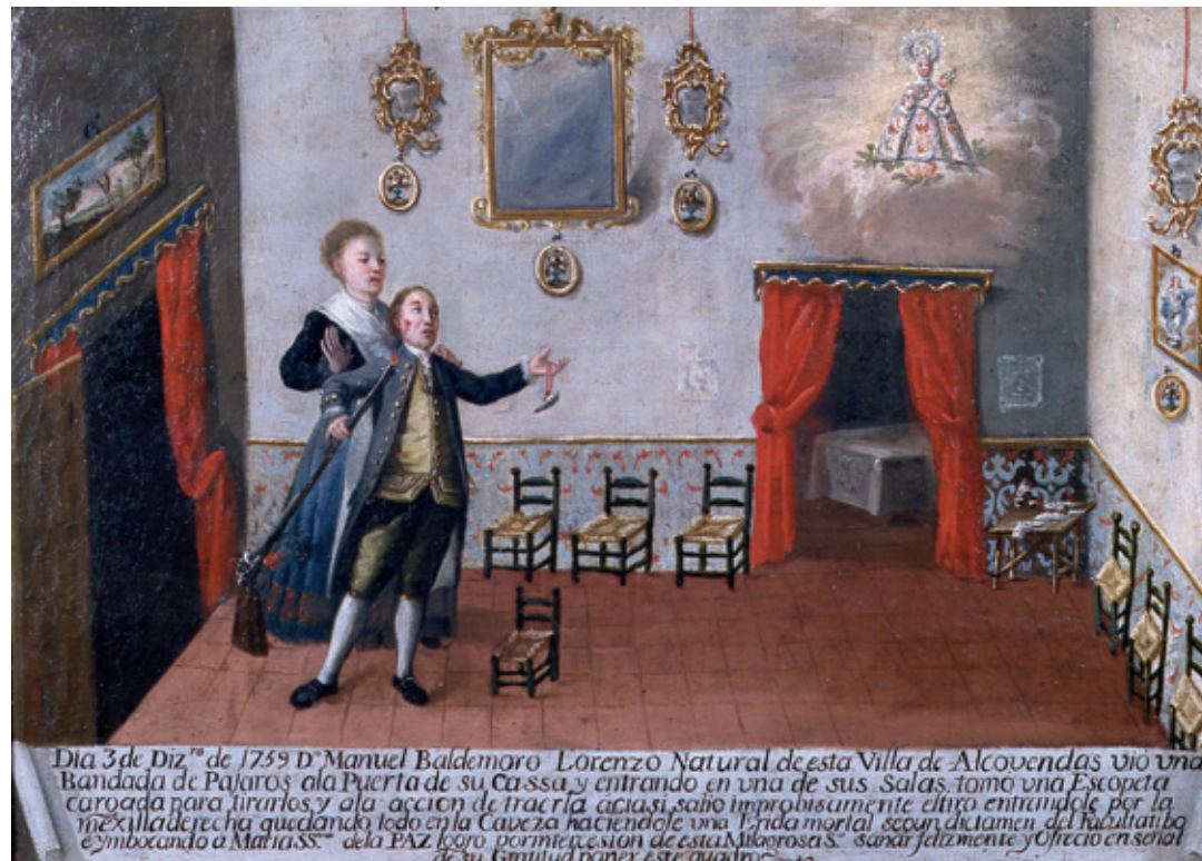
Exvoto de Manuel Baldomero Lorenzo [ 1759 ] Óleo sobre lienzo, 54 x 40 cm

22 de junio de 1991. Coronación Canónica de la Virgen de la Paz por el Cardenal D. Angel Suquía.