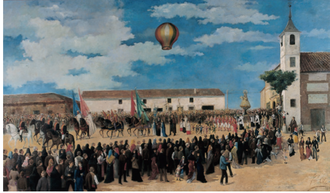
José Oliva Procesión de la Virgen de la Paz [1880] Cuadro conmemorativo del II Centenario del milagro del vino Óleo sobre lienzo, 150 x 256 cm

http://www.centrodeartealcobendas.es/ http://www.alcobendas.org/