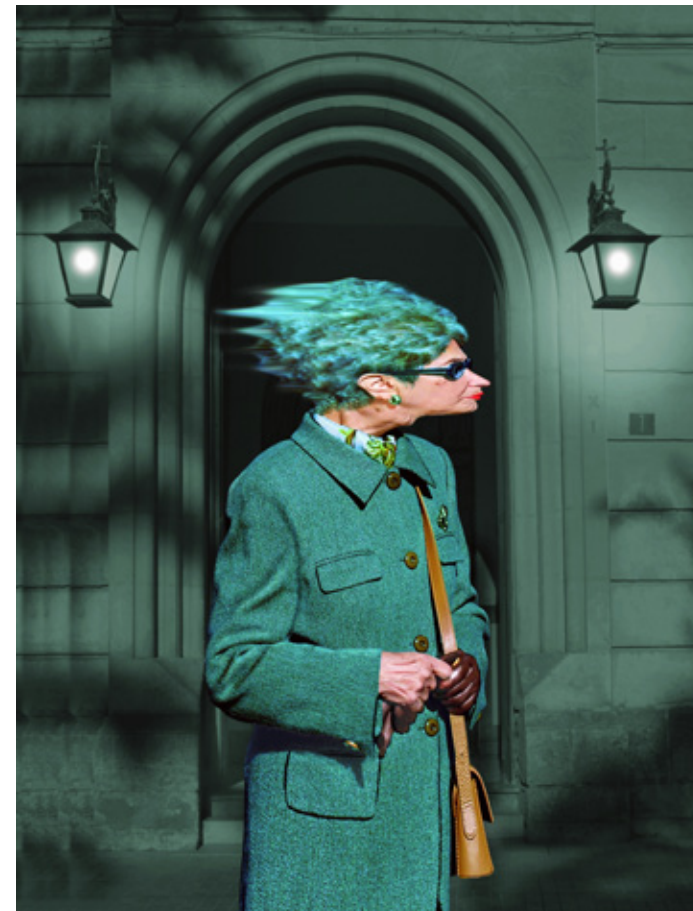
Obispa [ 2006 ]

Su trabajo dedicado casi en exclusiva al fotomontaje pero sin dejar a un lado su faceta de reportero (en ocasiones olvidada) constituye una oscura subversión frente a lo enraizado, frente al patrón cotidiano y frente al estándar de valores tradicionales de mediados del siglo XX.